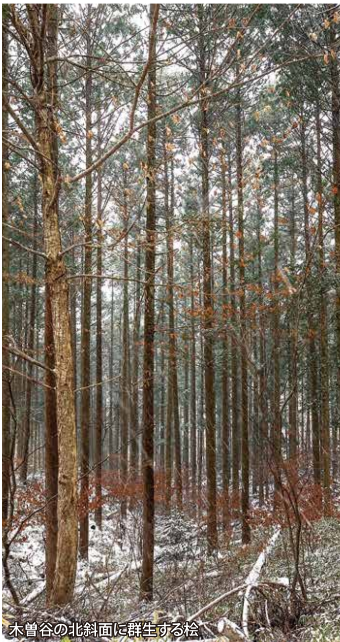
木曾谷の北斜面に群生する桧