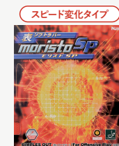
モリストSP (表ソフト)