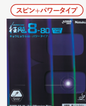
キョウヒョウ8-80/パワー