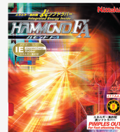
ハモンドFA (表ソフト)